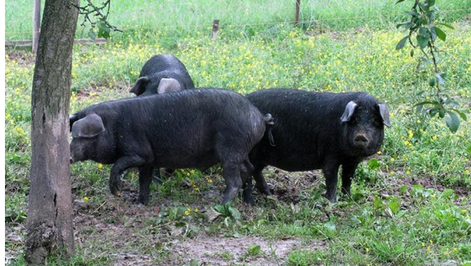
Slika 3. Crna slavonska svinja

Crna slavonska svinja (fajferica) je autohtona hrvatska pasmina. Meso je izuzetne kakvoće, prirast srednja, a prilagođena je tradicionalnom sustavu uzgoja na otvorenom. Nije sklona stresu i stvaranju BMV mesa, a preporuča se za proizvodnju slanine i trajnih suhomesnatih proizvoda.