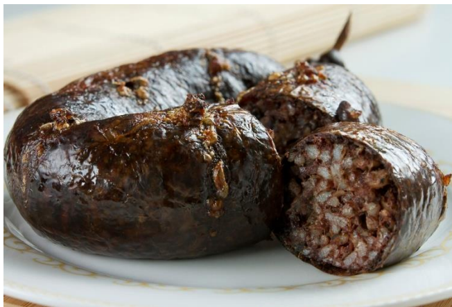
Slika 14. Krvavice

U industrijskoj proizvodnji krvavica nastoje se izbjeći problemi koje nalazimo kod domaćinstva, smanjiti varijacije u recepturi i mogućnost mikrobiološke kontaminacije. (web 6)