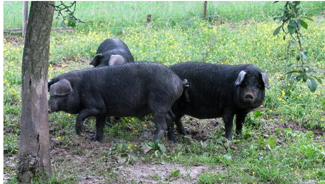
Slika 3. Crna slavonska svinja

Crna slavonska svinja (fajferica) je autohtona hrvatska pasmina. Meso je izuzetne kakvoće, prirast srednja, a prilagođena je tradicionalnom sustavu uzgoja na otvorenom. Nije sklona stresu i stvaranju BMV mesa, a preporuča se za proizvodnju slanine i trajnih suhomesnatih proizvoda.