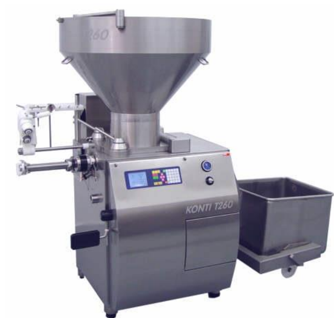
Slika 6. Vakuum punilica 'Vakuum filler F-line 260'

kontaminirati kulen. (Kovačević, 2014.) Okratoksin A je mikotoksin koji se u procesima tehnološke proizvodnje kulena (dimljenje, zrenje, fermentacija, sušenje) ne smanjuje, a u kulen dospijeva putem sirovine ili obrastanjem kulena rodovima plijesni Aspregillus i Penicillium . (web 1)