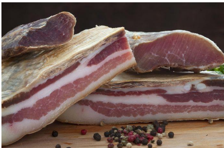
Slika 12. Domaća suha slanina