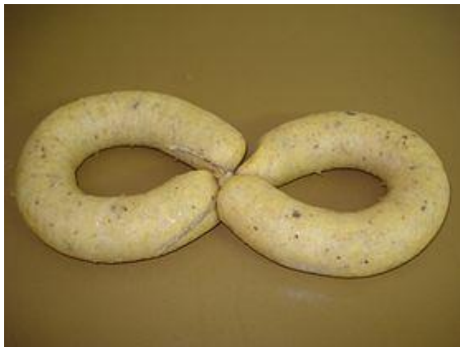
Slika 15. Bijele krvavice