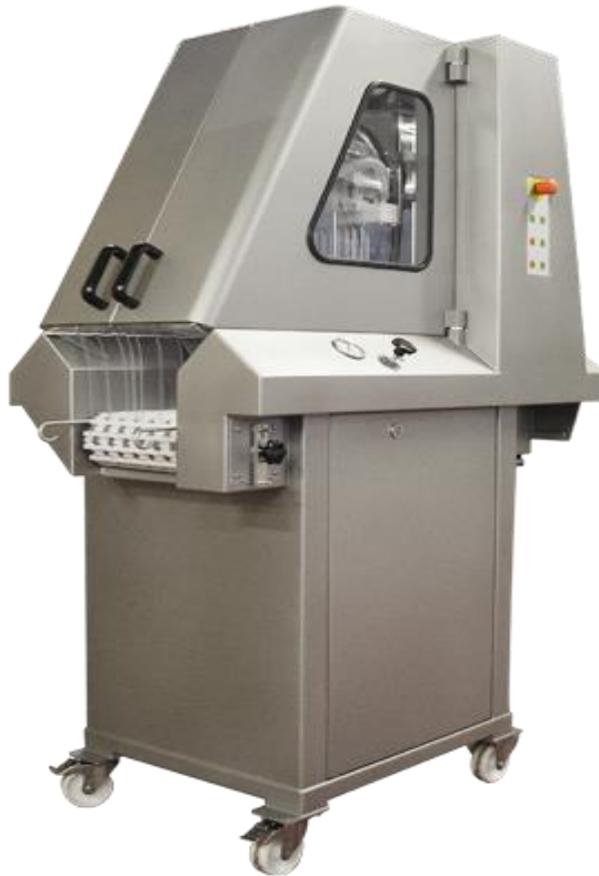
Slika 5. Uređaj za salamurenje 'Pickle-injector' PM-72