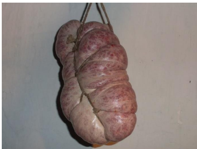
Slika 7. 'Šniranje' kulena