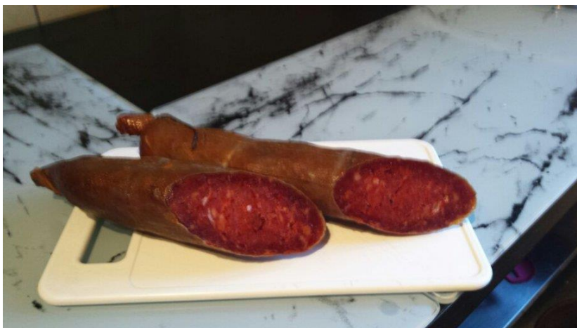
Slika 11. Kulenova seka

Proizvod slijedi arhitekturu zadnjeg svinjskog crijeva te je izdužen i nepravilnog oblika, polučvrste konzistencije. Izvan je boja tamnosmeđa do crvenkasta, dok je presjek svjetlo do tamnocrvene boje. Presjek ima izgled mozaika zbog mišićnog tkiva koje je crvene boje i masnog tkiva koje je bijele boje. Presjek ne smije imati šupljine i pukotine, a miris i okus moraju imati karakterističnu aromu po dimu.