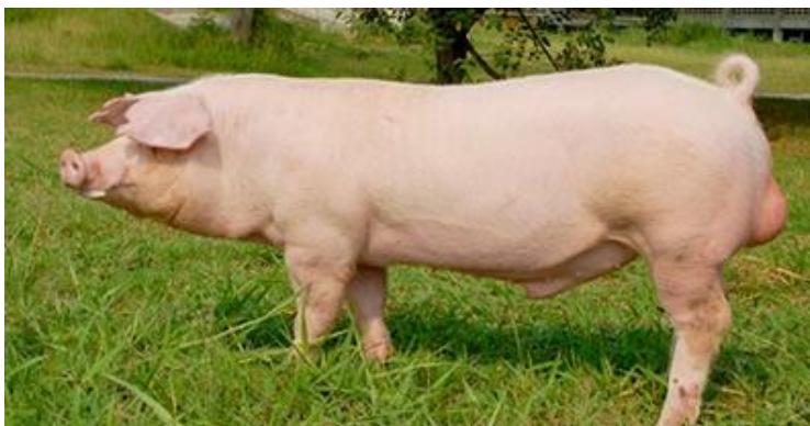
Slika 1. Švedski landras

Švedski landras je čistokrvna mesnata pasmina svinja te je najzastupljenija i uzgojno najznačajnija pasmina u RH. Svojstva su veliki prinos visokokvalitetnog mesa, najaveća plodnost,veliki prirast te dobra adaptivna svojstva. Meso švedskog landrasa je dobro za proizvodnju kulena i drugih trajnih kobasica.