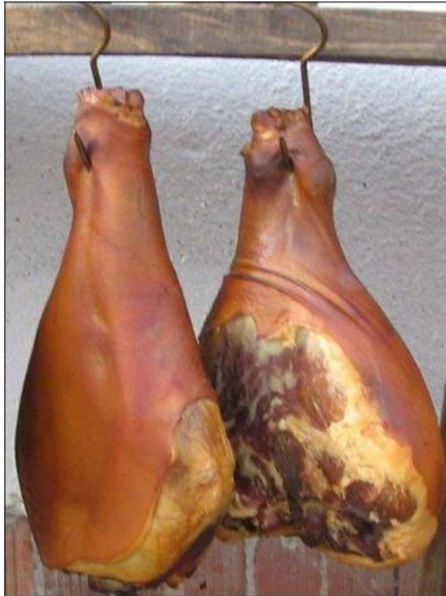
Slika 13. Slavonska šunka