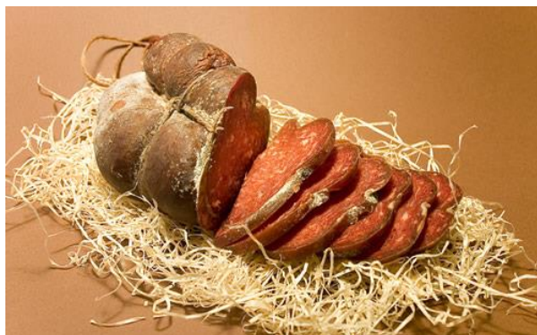
Slika 8. Zreli kulen

Kulen se na osnovi pH i a_w smatra trajnom kobasicom niske kiselosti, a mikrobiološka stabilnost i održivost je posljedica niskog aktiviteta vode. Ima visok sadržaj proteina, a nizak sadržaj masti. Sadržaj vlage i sadržaj proteina su na sličnoj razini što ukazuje na visoku hranjivost gotovog proizvoda. To je rezultat duljeg procesa sušenja i visokog udjela krtoga mesa u nadjevu. (web 2)