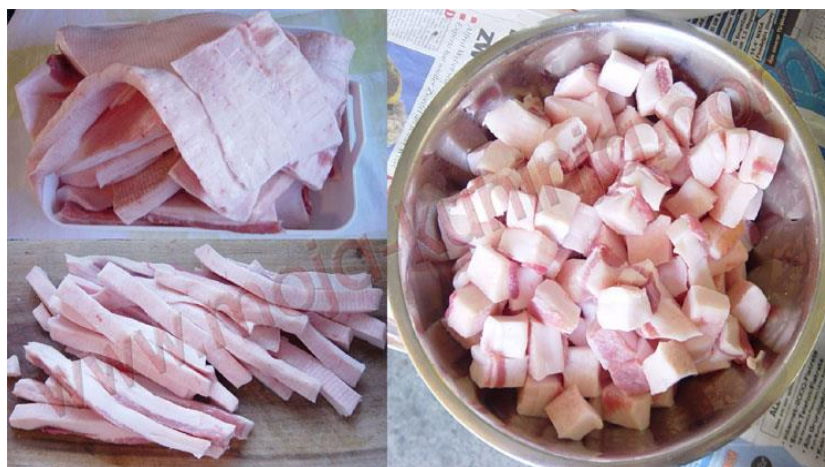
Slika 16. Priprema slanine za čvarke