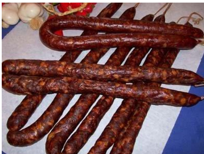
Slika 10. Domaća slavonska kobasica

Postoje značajne razlike u koncentraciji masti, proteina i kolagena u različitim kobasicama, dok su pH i a_w vrijednosti slične, što upućuje na različite recepture, ali upotrebu istih tehnoloških procesa proizvodnje kod različitih domaćinstava.