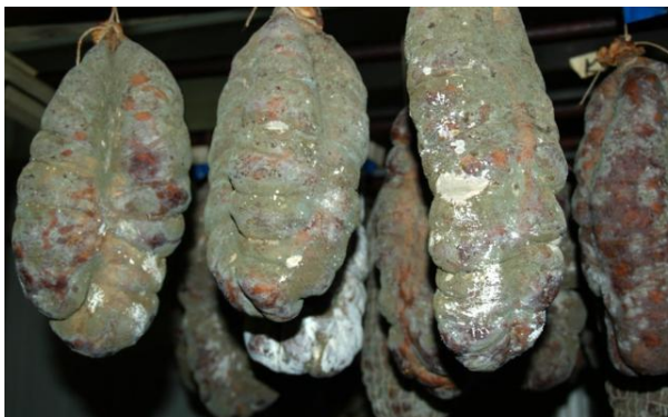
Slika 9. Kulen obrastao s plijesni