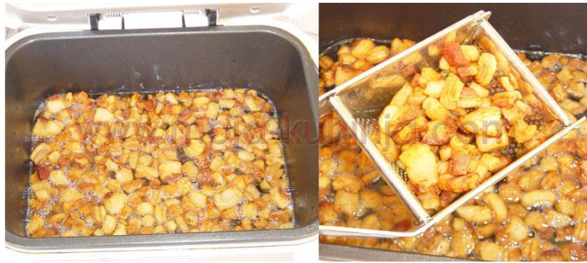
Slika 17. Prženje čvaraka