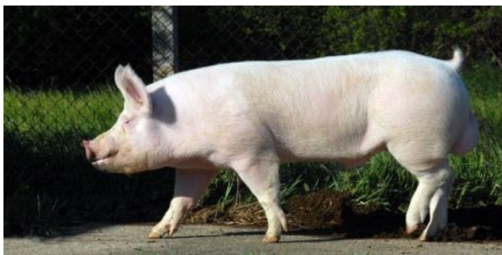
Slika 2. Veliki jorkšir

Veliki jorkšir je najraširenija pasmina svinja u svijetu. Dobra kakvoća mesa, meso je mramorirano, snažne konstitucije, visok prirast te manja osjetljivost na stres. Meso je dobro za proizvodnju kulena i drugih trajnih kobasica.