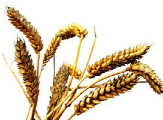
Slika 6 Zaraženi klas pšenice (Web 5)