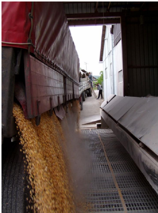
Slika 13 Istovar pšenice (Web 9)

Nakon što vozilo uđe u krug silosa, ide na istovar pšenice. Istovar se vrši na način da se vozilo parkira na ležište (tzv. bertoju) te se samoistovara, ukoliko vozilo ima takvu mogućnost, ili se pomoću hidrauličkog cilindra nagne kako bi se pšenica istovarila. Pšenica se istovara na rešetke ispod kojih se nalazi prijemni bunker, u kojem se nalazi transporter (redler), a iznad rešetke se nalazi sakupljač prašine.