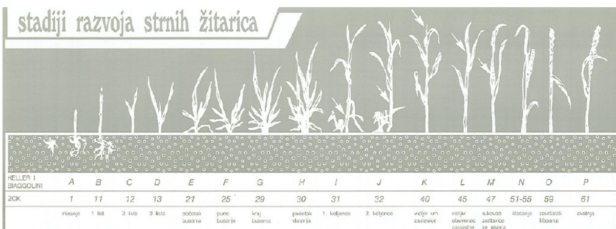
Slika 2 Stupnjevi razvoja strnih žita

Faze koje biljka prolazi: bubrenje i klijanje, nicanje, ukorjenjavanje, busanje, vlatanje, klasanje, cvjetanje i oplodnja, formiranje, naljevanje i sazrijevanje zrna.