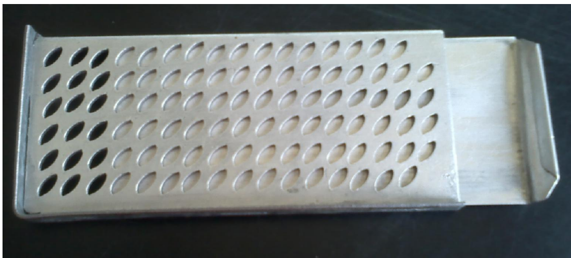
Slika 9 Ručni brojač zrna pšenice

Postupak rada: Iz pročišćenog uzorka broji se 100 zrna po 4 puta za svaki uzorak te se dobivena masa množi s 10. Brojanje se može provesti pomoću metalne ploče na kojoj s nalaze utori za 100 zrna (ručni brojač zrna).