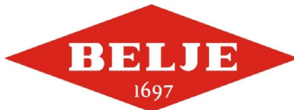
Slika 1 Logo dijioničarskog društva Belje

Tri stotine godina na području Baranje i „Belja“ razvija se poljoprivredna proizvodnja i s njom prerađivačka industrija. Pojam „Belje“ vezan je za Dobro koje je 1697. godine austrijski vojskovođa Eugen Savojski dobio od austrijskog dvora kao nagradu za pobjedu nad Turcima. Prema imenu naselja Bilje, prema njegovom mađarskom izgovoru ( Bellye ), dobiva ime „Belje“. Stvaranjem Dobra na području Baranje, koje se tada prostiralo i na područje susjedne Mađarske, udareni su temelji gospodarstva koje će se sve do danas razvijati. ( Tri stoljeća „Belja“, 1986 )