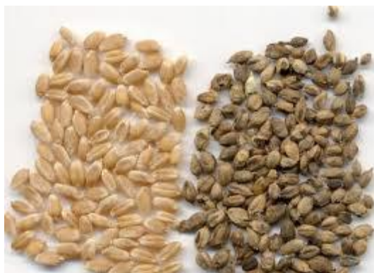
Slika 7 Prikaz zdrave (lijevo) i zaražene (desno) pšenice (Web 6)