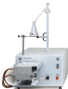
Slika 11 Farinograf (Web 7)

Farinograf je uređaj kojim se određuju svojstva i ponašanje tijesta pri miješanju. Princip rada farinografa se temelji na mjerenju otpora koje pruža tijesto pri miješanju u vremenu od trenutka formiranja tijesta do punog razvoja i tijekom daljnjeg miješanja do zaustavljanja miješalice. Analiza počinje zamjesom tijesta i traje 15 minuta, za to vrijeme uređaj ispisuje graf (farinogram) analize tijesta. Očitanjem farinograma se dolazi do podataka povezanih uz sposobnost upijanja, razvoj tijesta, stabilnost tijesta, otpor tijesta, stupanj omekšanja te elastičnosti i rastezljivosti tijesta, te se izračunavanjem površine koju zatvara farinografska krivulja te konzistencija od 500 FJ može odrediti kvalitetni broj i kvaliteta skupina. (Kljusurić, 2000)