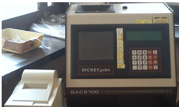
Slika 8 Dickey-john uređaj

Nakon uključivanja uređaja potrebno je u izborniku odrediti što želite raditi (odrediti) te koja se kultura analizira. Uređaj ima mogućnost unošenja identifikacijskog broja (broj vagarskog lista) te ga se unosi jer je bitan za sljedivost robe, ali i za obračun. Zatim se puni lijevak na vrhu uređaja te se pritiskom na tipku pokreće uređaj. Uređaju je potrebno jedno kraće vrijeme za očitavanje vrijednosti. Uz uređaj se nalazi i pisač koji po potrebi, ispisuje rezultate analize u dva primjerka, jedan se daje vozaču te ga on predaje osoblju na istovaru, a drugi služi za obračun.