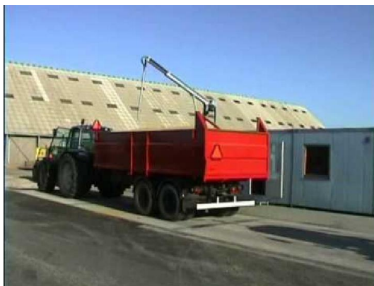
Slika 4 Automatska sonda

Uzorak koji se uzima automatskom sondom kroz cijev odlazi u „mali“ prijemni laboratorij gdje ga se obrađuje.