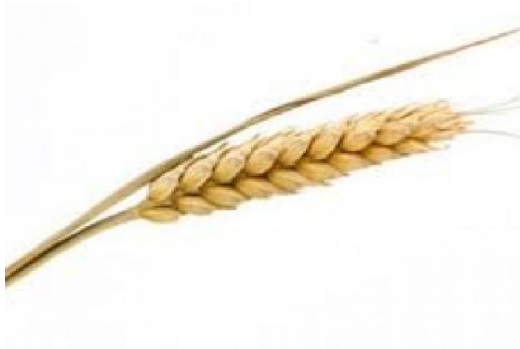
Slika 5 Zdrav klas pšenice (Web 4)

Postupci s pšenicom tijekom prijema u Belje d.d., PC Mlin