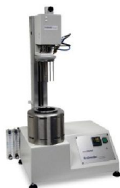
Slika 12 Amilograf (Web 8)

Amilograf je rotacijski viskozimetar koji bilježi promjenu viskoznosti suspenzije brašna i vode tijekom zagrijavanja i daje podatke o tijeku želatinizacije škroba. Iz grafa koji uređaj oblikuje tijekom mjerenja može se pratiti tijek želatinizacije, ali najvažniji podatak koji se očitava je maksimalna viskoznost izražena amilolitičkim jedinicama (AJ). (Đaković, 1997)