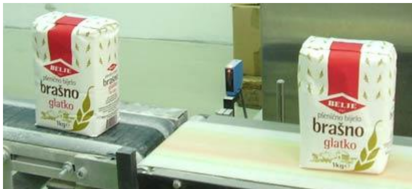
Slika 15 Pakiranje brašna (Web 1)

Dobiveno brašno se usmjerava u mješalice iz kojih se uzimaju uzorci za laboratorijsku analizu na temelju koje se vrši skladištenje po komorama. Brašno se pakira u ambalažu od 1, 2, 5, 25 i 50 kg ili se prodaje rinfuzno ( cisterne ).