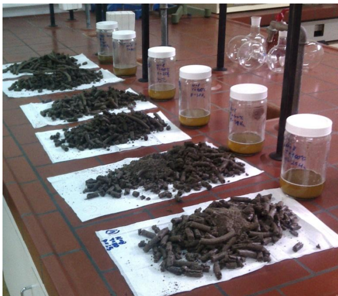
Slika 5 Nepročišćeno sirovo ulje i uljna pogača