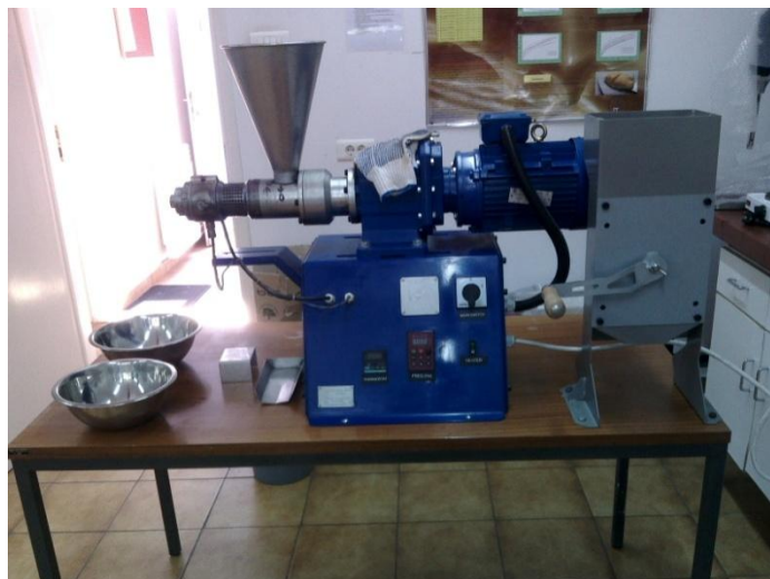
Slika 4 Pužna preša

Regulacija debljine izlazne pogače u preši se postiže odgovarajućom konstrukcijom izlaznog konusa, a preko različite debljine pogače regulira se radni tlak u preši (Rac, 1964.).