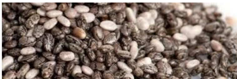
Slika 2 Tamne i bijele sjemenke chie

Chia se može upotrebljavati u obliku cijelog sjemena, brašna, gela i ulja sjemenki. Sjemenke imaju osobinu izrazite hidratacije te pomiješane s vodom nabubre i povećaju svoj volumen do 3 puta. Nakon namakanja postoji bezbroj načina upotrebe, mogu se koristiti za pripravljanje: palačinki, salata, raznih kolača, tradicionalnih jela, ali i juha, sendviča ili umaka. Sjemenke se moraju dodati u jelo na kraju kuhanja kako ne bi bile podvrgnute dužoj termičkoj obradi jer povišena temperatura uništava veći dio hranjivih tvari. Chia sjemenke ne sadrže gluten, pa brašno proizvedeno mljevenjem sjemenki može poslužiti kao zamjena za pšenično brašno kod osoba koje su osjetljive na gluten.